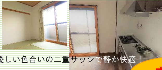
優しい色合いの二重サッシで静か快適！

会場内にマスクをご準備しており、感染症対策に取り組んでおります。手の消毒、マスク着用のご協力をお願いいたします。