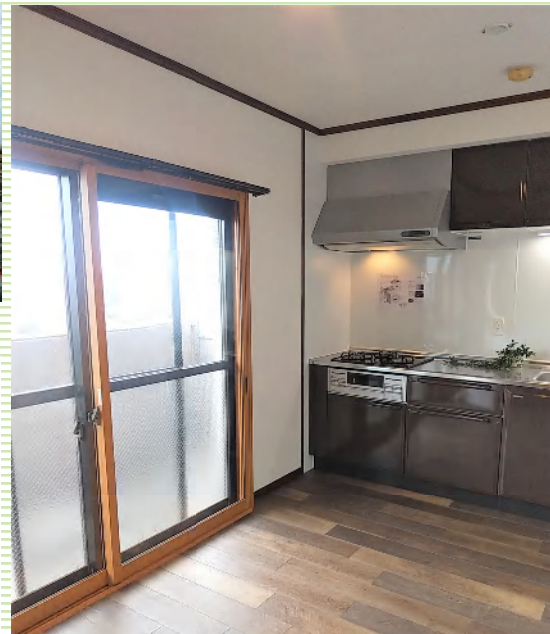
落ち着いた色合いのダイニングキッチン！ 毎日ゆっくり過ごせそう！