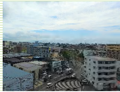
最上階なので見晴らし良好！