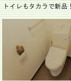
トイレもタカラで新品！