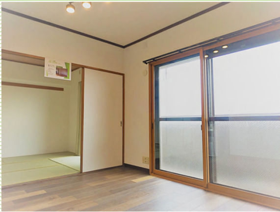
和室→洋室変更プランあり（別途工事費用）