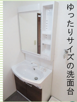
ゆったりサイズの洗面台