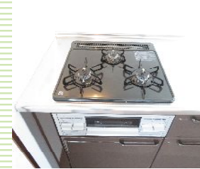
油汚れに強いホーローキッチン