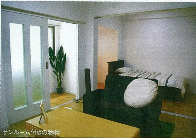
サンルーム付きの物件

福岡市出身。1950年9月11日生まれの70歳。90年に社長就任。趣味は将棋、読書