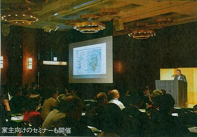
家主向けのセミナーも開催